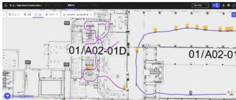
図面上にある Walkthrough の軌跡

歩いて 360 度動画を撮影するだけで、図面上の歩いた位置を AI が自動で認識して画像を切り出して図面上にプロットしてくれる「Walkthrough 機能」や BIM データとの連携機能も搭載されています。