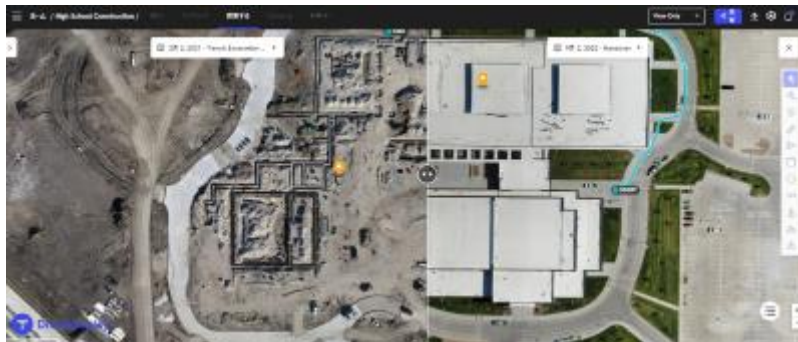
DroneDeploy から作成した全体マップ